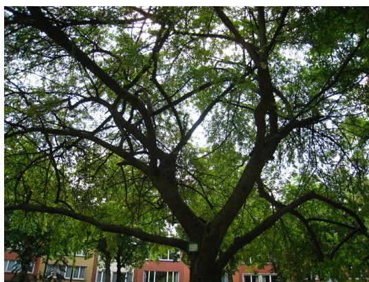
, 29 Juillet 2008