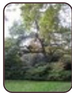
Chêne du Japon Saint-Josse-Ten- Noode Jardin Botanique