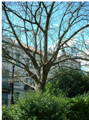
Catalpa rougeâtre, Square Armand Steurs