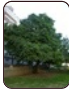
Marronnier jaune Saint-Josse-Ten- Noode Square Armand Steurs Square Armand Steurs