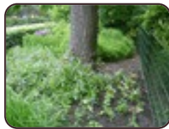
Liriodendron tulipifera var. integrifolia Saint-Josse-Ten- Noode Jardin Botanique