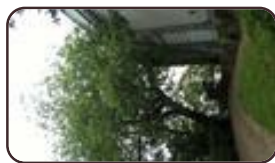
Mûrier noir Saint-Josse-Ten- Noode Jardin Botanique