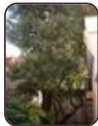
Chêne vert Saint-Josse-Ten- Noode Rue du Cadran, 28