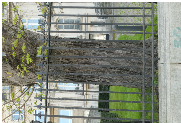
Marronnier à fleurs rouges,