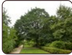
Erable Trautvetter Saint-Josse-Ten- Noode Jardin Botanique