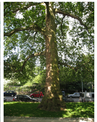
Platane à feuille d'érable, Jardin Botanique