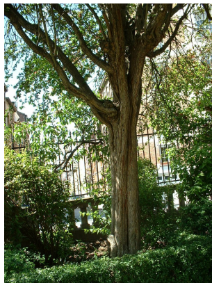
Aubépine à deux styles, Square Armand Steurs