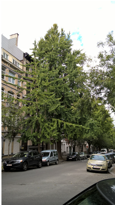
Ginkgo biloba 'Fastigiata', Huart Hamoiriaan en Rigasquare