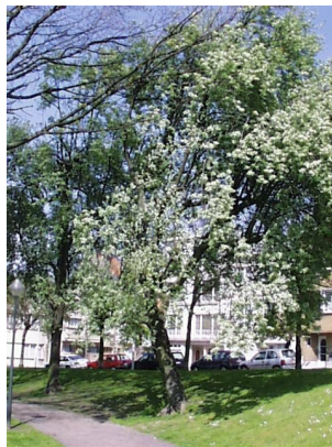
Sorbus aria f. lutescens, Huart Hamoirlaan en Rigasquare