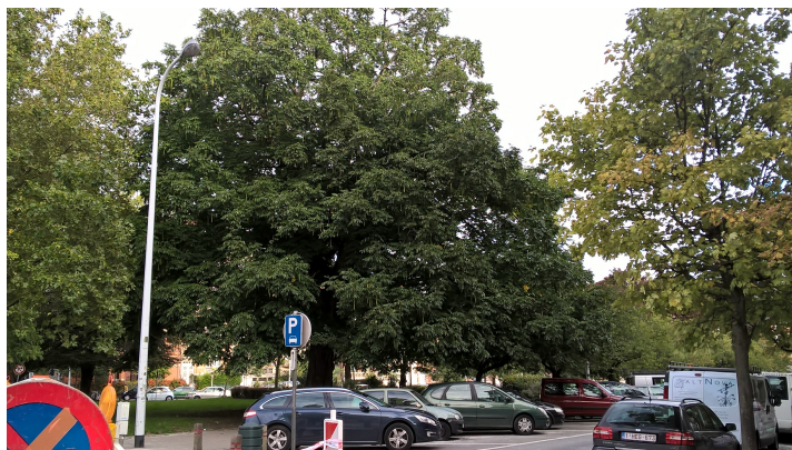
Kaukasische vleugelnoot, Huart Hamoirlaan en Rigasquare