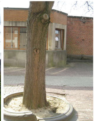
Ulmus glabra 'Pendula',