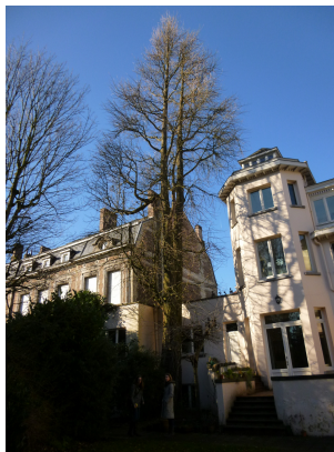
Arbre aux quarante écus,