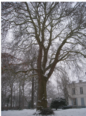
Platane d'Orient, Propriété Voot