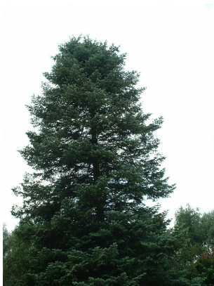
Sapin du Colorado,