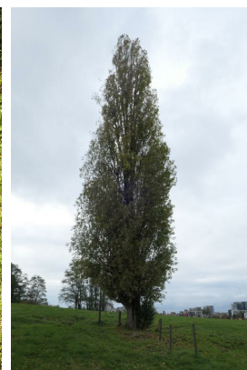
Peuplier d'Italie, Zavelenberg