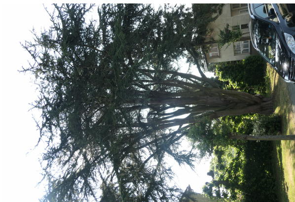
Cèdre de l'Atlas,