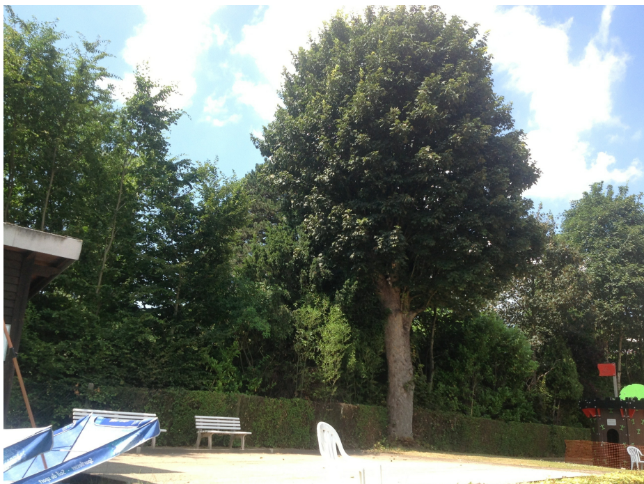
Acer pseudoplatanus 'Purpurascens',