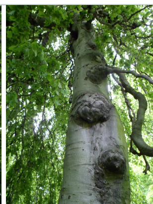
, 15 Mei 2012