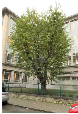
Ostrya carpinifolia ,