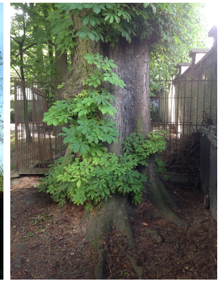
Witte paardenkastanje, Jean Felix Haptuin