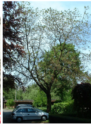
rompetboom, Park van het Sint-Michielskollege