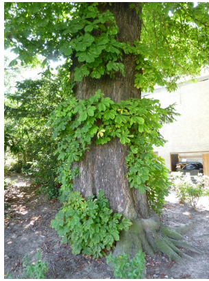
, 21 August 2013