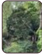
Chamaecyparis obtusa Ganshoren de Villegaslaan, 25