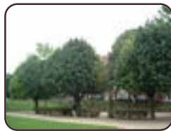
Meelbes St.- Gillis Louis Moricharplein