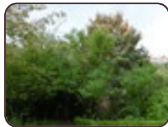
Syringa vulgaris St.- Gillis Edouard Ducpétiauxlaan, 106