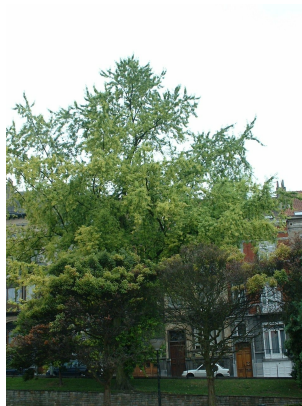
Acer saccharinum var. laciniatum ,