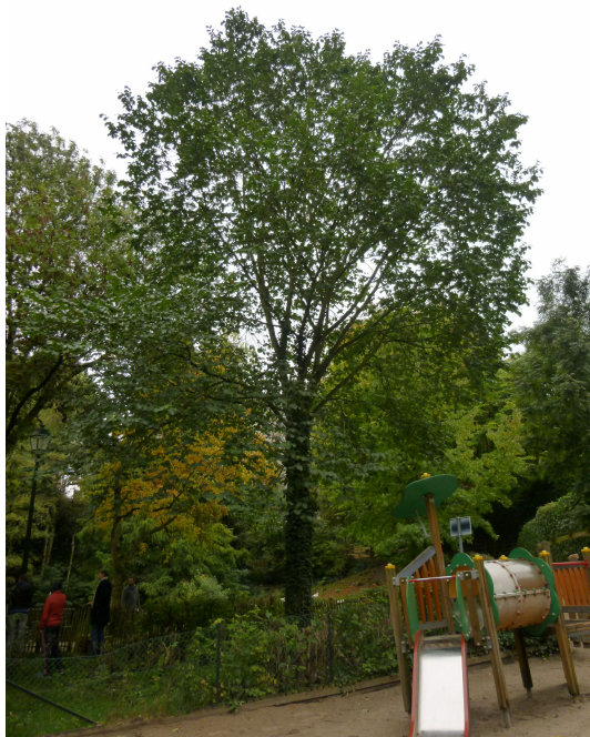
Ruwe iep, Pierre Pauluspark