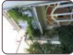
Wijnstok St.- Gillis Overwinningstraat, 213