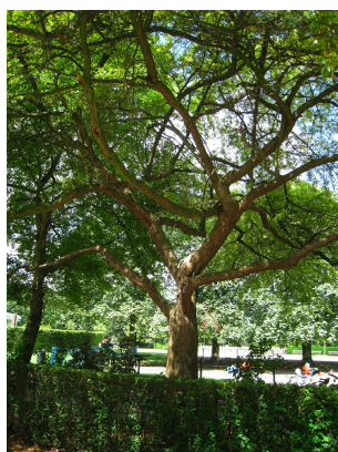
, 29 Juillet 2008