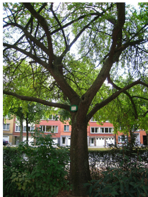
, 29 Juillet 2008