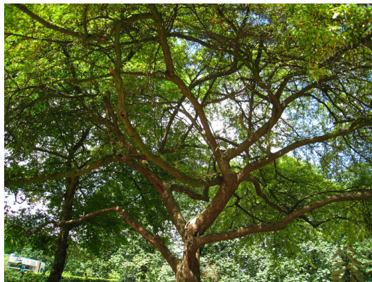
, 29 Juillet 2008