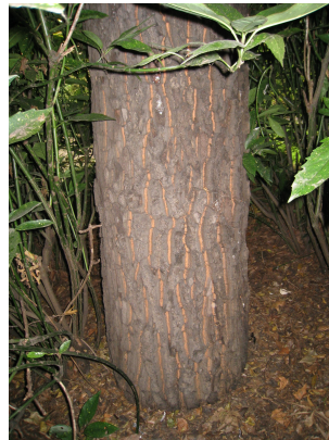
Quercus acutissima, Kruidtuinpark