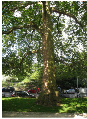
Gewone platan, Kruidtuinpark