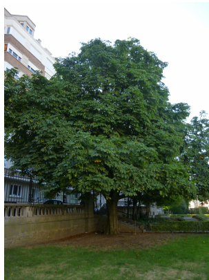
Aesculus flava, Armand Steurssquare