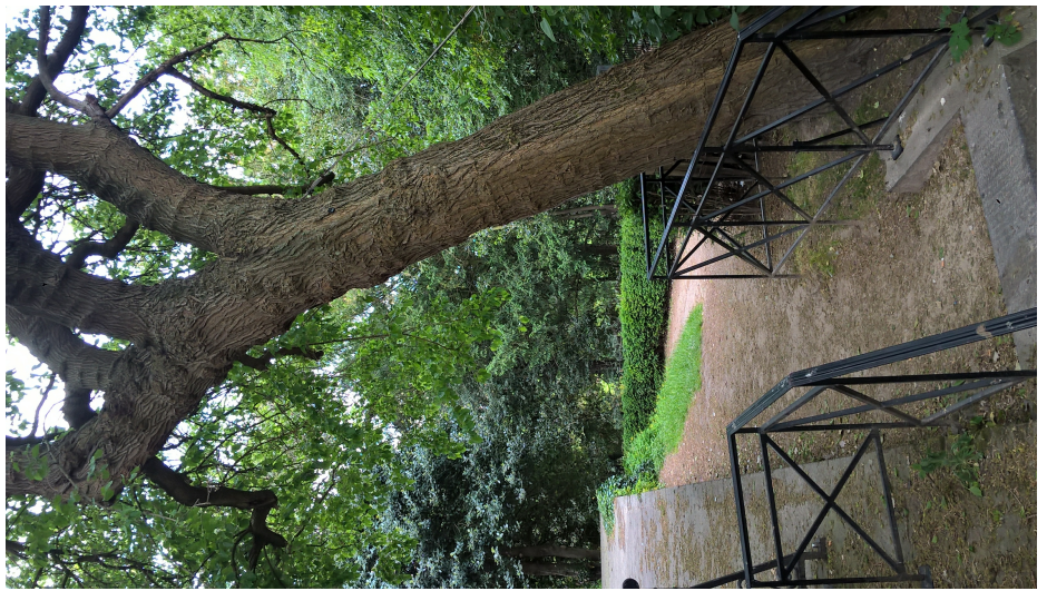
Zwarte moerbe, Kruidtuinpark