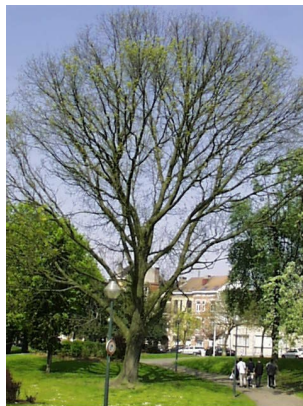
Frêne de Biltmore, Avenue Huart Hamoir et Square Riga