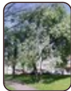
Sorbus aria f. lutescens Schaerbeek Avenue Huart Hamoir et Square Riga Avenue Huart Hamoir