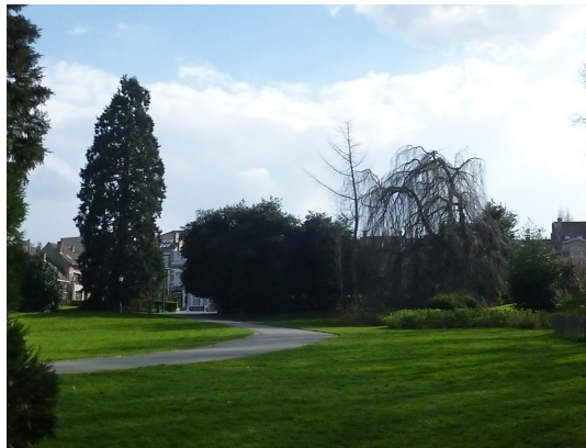
Sequoia géant, Parc Josaphat