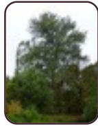
Peuplier du Canada Schaerbeek Parc Josaphat