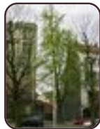
Ginkgo biloba 'Fastigiata' Schaerbeek Avenue Huart Hamoir et Square Riga Avenue Huart Hamoir