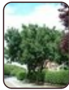
Osmanthe de Burkwood Schaerbeek Boulevard Lambermont, 374