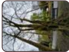
Chamaecyparis obtusa Schaerbeek Parc Josaphat Avenue Général Eisenhower