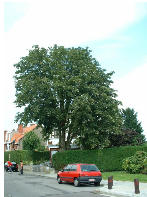
Marronnier à fleurs rouges,