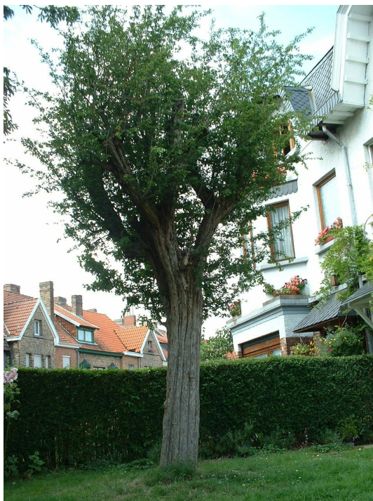
Aubépine à deux styles,