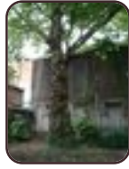
Platane à feuille d'érable Schaerbeek Avenue de la Reine, 141