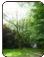
Vogelkers Schaarbeek Kolonel Bourgstraat