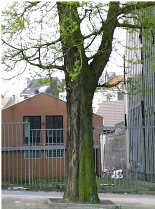
Ginkgo biloba 'Fastigiata', Huart Hamoiriaan en Rigasquare