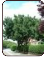
Osmanthus x burkwoodii Schaarbeek Lambermontlaan n, 374