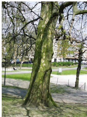
Gewone plataan, Huart Hamoiriaan en Rigasquare