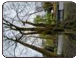
Chamaecyparis obtusa Schaarbeek Josaphatpark Generaal Eisenhowerlaan