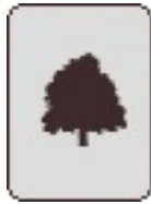
Betula pendula f. youngii Woluwé-Saint- Lambert Rue Konkel, 174