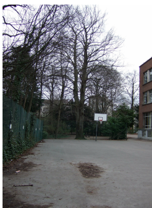
Hêtre d'Europe, Ancienne propriété Lindthout