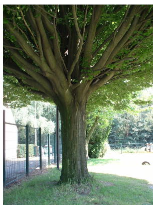
Carpinus betulus f. fastigiata ,