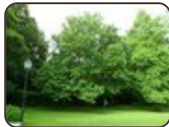
Magnolier à feuilles acuminées Woluwé-Saint- Lambert Parc Malou