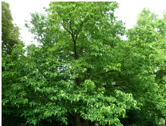
Magnolier à feuilles acuminées, Parc Malou