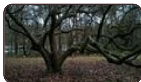
Magnolier de Soulange Woluwé-Saint- Lambert Moulin de Lindekemaele et abords Avenue Jean- François Debecker, 48