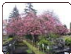
Cerisier du Japon Woluwé-Saint- Lambert Avenue du Dernier Repos