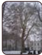
Platane d'Orient Woluwé-Saint- Lambert Propriété Voot Rue Voot, 67