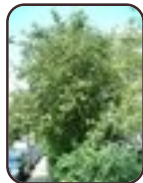
Cognassier commun Woluwé-Saint- Lambert Avenue de l'Idéal, 9