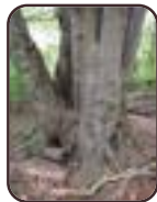
Hêtre d'Europe Woluwé-Saint- Lambert Parc des Sources et propriété Solvay