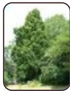
Chêne pédonculé fastigié Woluwé-Saint- Lambert Avenue de la Chapelle, 35