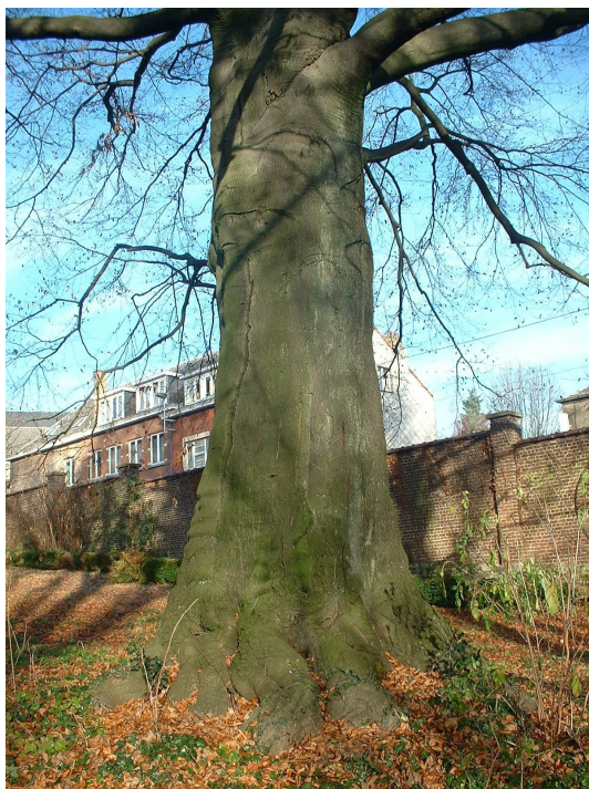
Hêtre pourpre, Place du Sacré-Coeur