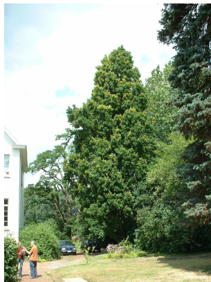
Chêne pédonculé fastigié,