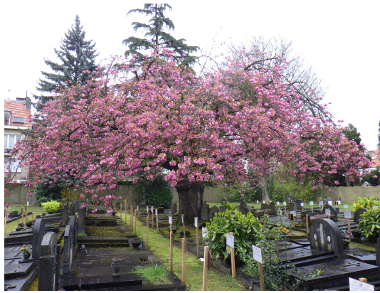
Cerisier du Japon,