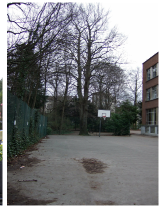
Hêtre d'Europe, Ancienne propriété Lindthout