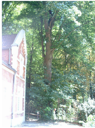
, 30 August 2005