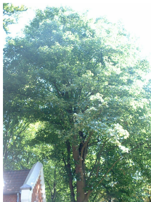
, 30 August 2005