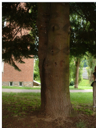
, 02 August 2005

XLSX (Excel 2007) - XLS (Excel 1997-2003) .