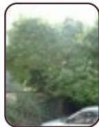
Magnolia sp St.- Agatha - Berchem Openveldstraat, 90-92