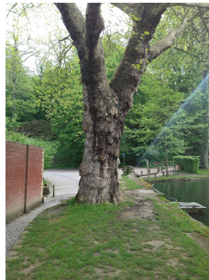
, 11 Mei 2023