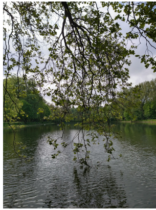
, 11 Mei 2023