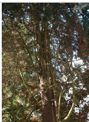
, 11 September 2003