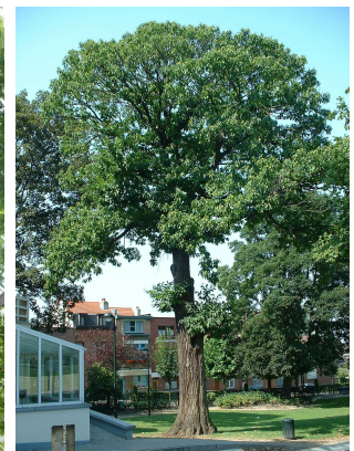
, 04 Août 2003