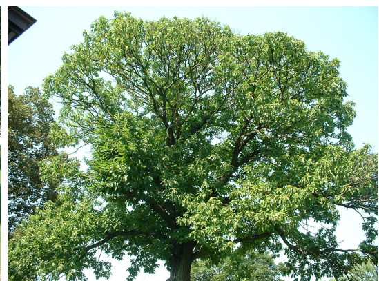
, 04 Août 2003