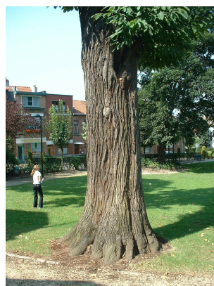
, 04 Août 2003