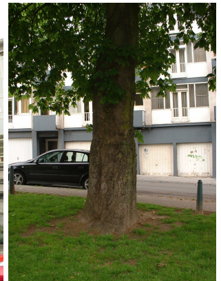
Marronnier à fleurs rouges,