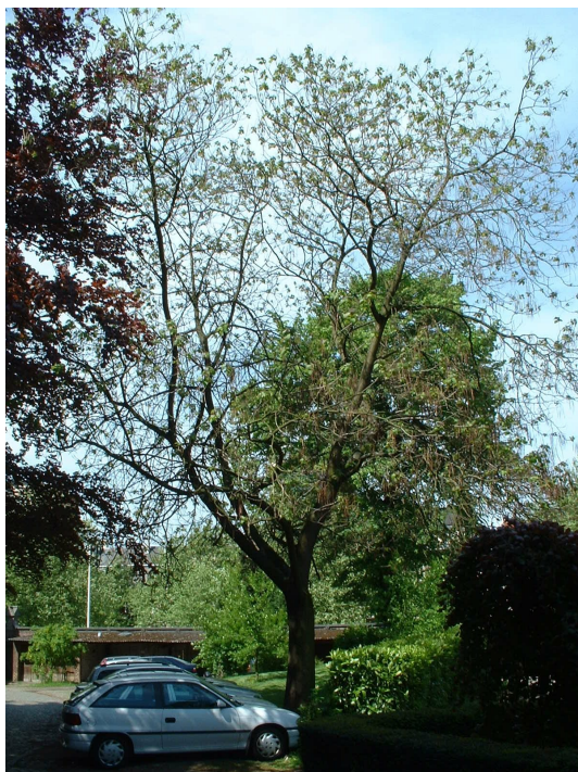
Catalpa rougeâtre, Parc du collège Saint-Michel