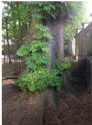
Marronnier commun, Jardin Jean Félix Hap