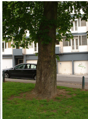
Marronnier à fleurs rouges,