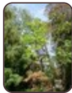
Catalpa rougeâtre Etterbeek Jardin Jean Félix Hap