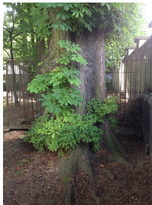
Witte paardenkastanje, Jean Felix Haptuin