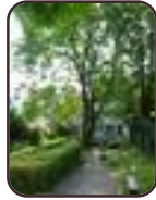
Hemelboom Etterbeek Charles De Buckstraat, 23