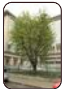
Ostrya carpinifolia Etterbeek Generaal Fivéstraat