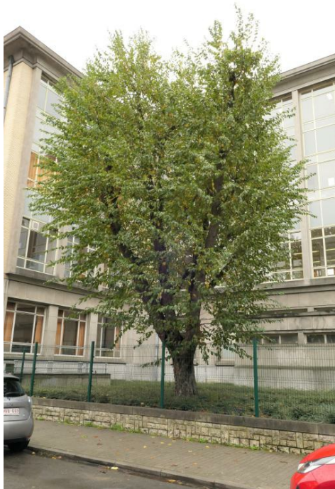
Ostrya carpinifolia ,