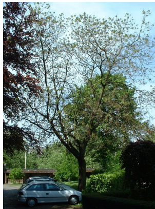
rompetboom, Park van het Sint-Michielskollege