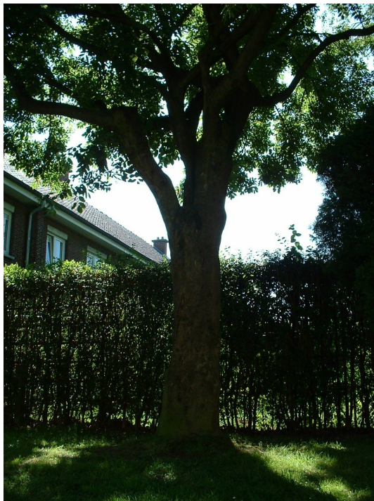
Pluimes, Tornooveld wijk