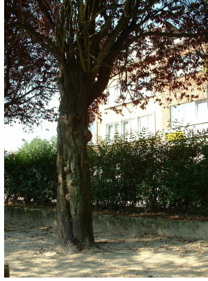
Prunus cerasifera f. spaethiana ,