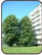
Krimlinde Evere Tornooiveld wijk Strijdrooslaan