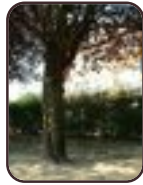
Prunus cerasifera f. spaethiana Evere Hendrik Consciencelaan