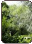
Salix sp Evere Marnestraat, 5