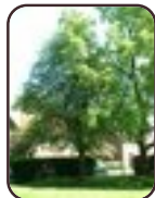
Gewone of wilde lijsterbes Evere Tornooiveld wijk Riddervaanlaan