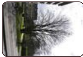
Gewone esdoorn Evere Henry Dunantlaan