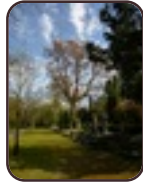
Noorse esdoorn Evere Begraafplaats van Brussel