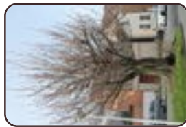
Japanse Sierkers Ganshoren Jean-Baptiste Van Pagéstraat